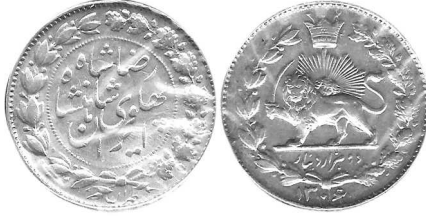
0512A 060101 دو هزار دینار ۱۳۰۶