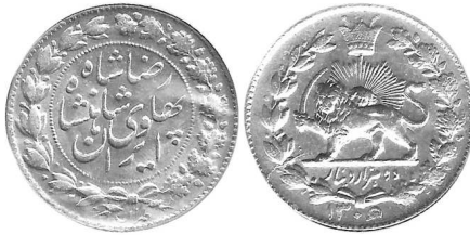
0512A 060201 دو هزار دینار ۱۳۰۶ سورشازژ تاریخ