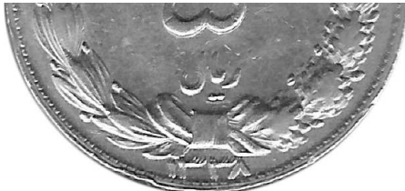
0624N 380103 پنج ریالی ۱۳۳۸ نوع اول مکرر تاریخ