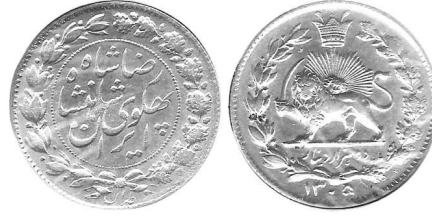
0512A 050201 دو هزار دینار ۱۳۰۵