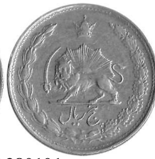
0624N 380101 پنج ریالی ۱۳۳۸ نوع اول (ضخیم)