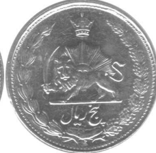
0624N 370101 پنج ریالی ۱۳۳۷