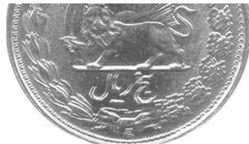
0624N 380102 پنج ریالی ۱۳۳۸ نوع اول ضرب مکرر